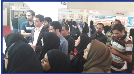
شورای دبیران انجمن های علمی - دانشجویی برگزار کرد: