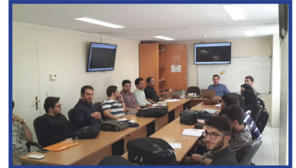
انجمن علمی - دانشجویی الکترونیک برگزار کرد: