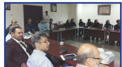
انجمن علمی - دانشجویی آمار برگزار کرد:

در تاریخ ۱۰ مهرماه ۹۵ جلسه معارفه گروه بیماری شناسی گیاهی برای دانشجویان ورودی جدید از سوی انجمن علمی - دانشجویی بیماری شناسی گیاهی با حضور دانشجویان و اساتید گروه برگزار شد. در طی این جلسه بعد از قرائت آیاتی از قرآن کریم، نماهنگی در مورد تاریخچه دانشگاه تربیت مدرس و دانشکده کشاورزی و گروه بیماری شناسی گیاهی نمایش داده شد. سپس دانشجویان و اساتید گروه خود را معرفی کردند و در ادامه هر کدام از اساتید صحبت های مختصری برای دانشجویان ارائه کردند.